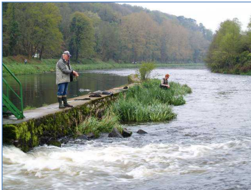
Le dimanche matin, le niveau d'eau avait perdu 30 cms

Le niveau d'eau qui a baissé de 30 cm par rapport à la veille, le soleil timide et un vent de nord ouest soutenu ainsi que les températures plus fraîches ont marqué les 2 dernières manches de qualification de leur empreinte puisque malgré la qualité et le niveau des compétiteurs aucune alose n'a été sortie de l'eau. Les quelques tapes enregistrées ont malgré tout révélé la présence de quelques aloses.