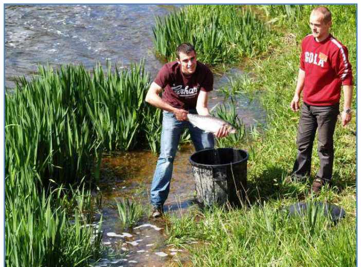
toutes les aloses capturées ont été relâchées dans de bonnes conditions