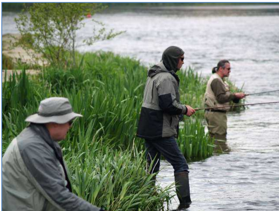
Malgré la concentration de nos finalistes, aucune alose capturée lors des finales