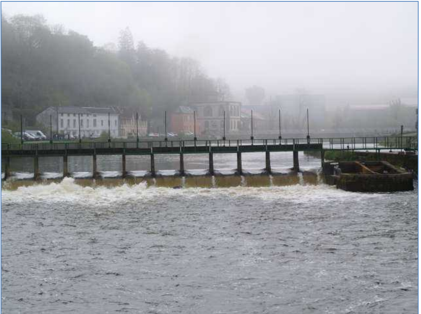
Le barrage des Gorêts au matin du samedi 18 avril

Le débit est élevé et l'eau est légèrement teintée, les températures sont plutôt fraîches et le ciel bien bouché. Les conditions sont moyennes mais, l'apparition du soleil attendue dans la matinée devrait favoriser l'activité des aloses.