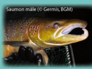
Saumon mâle