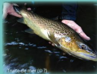
Truite de mer (© ?)