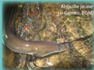
Anguille jaune