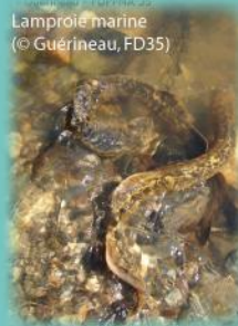
Lamproie marine