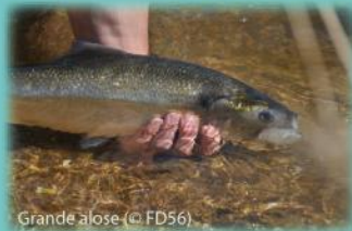
Grande alose