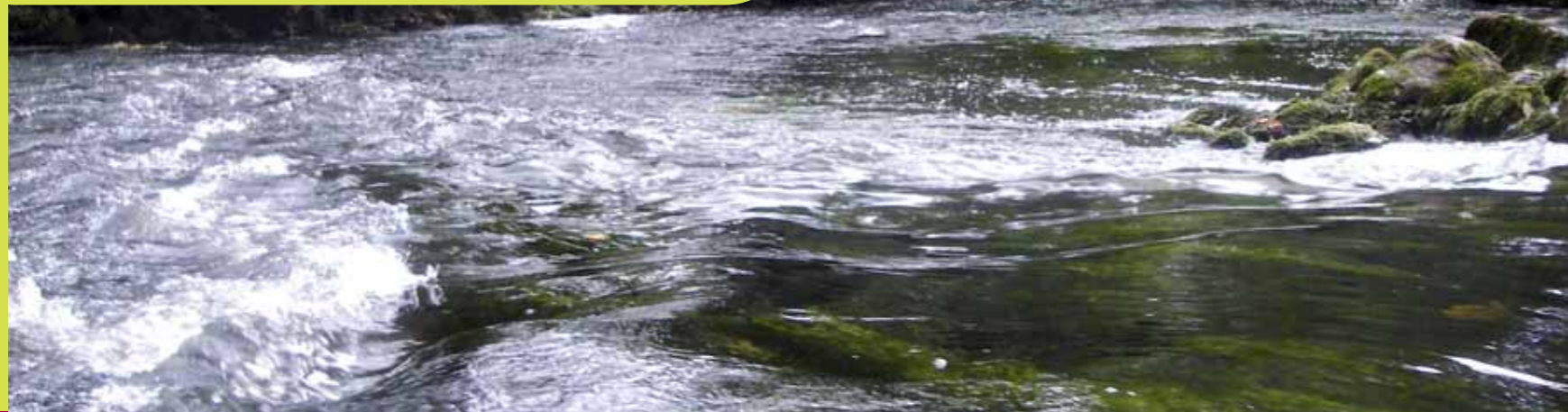
Y. Le Clainche

La vieille rivière, dernier petit bout de Blavet originel en Morbihan.