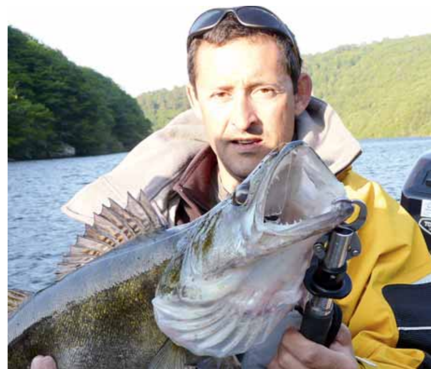
Le sandre réserve toujours de belles émotions. ▲