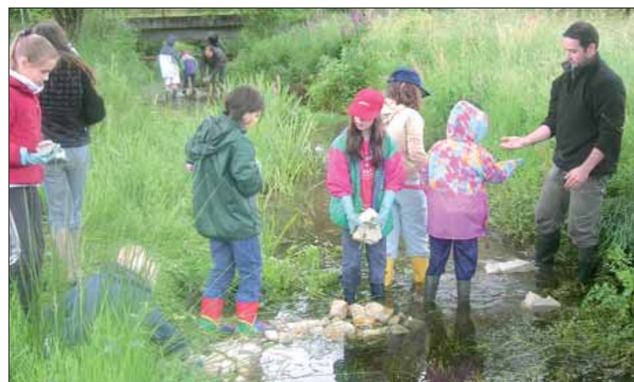
Les enfants de Langonnet, acteurs d'aujourd'hui et de demain de la réhabilitation de leur ruisseau.

habitants de se réapproprier leur rivière. A ce jour des animations sont déjà programmées pour réaliser un sentier d'interprétation dès l'été 2010.