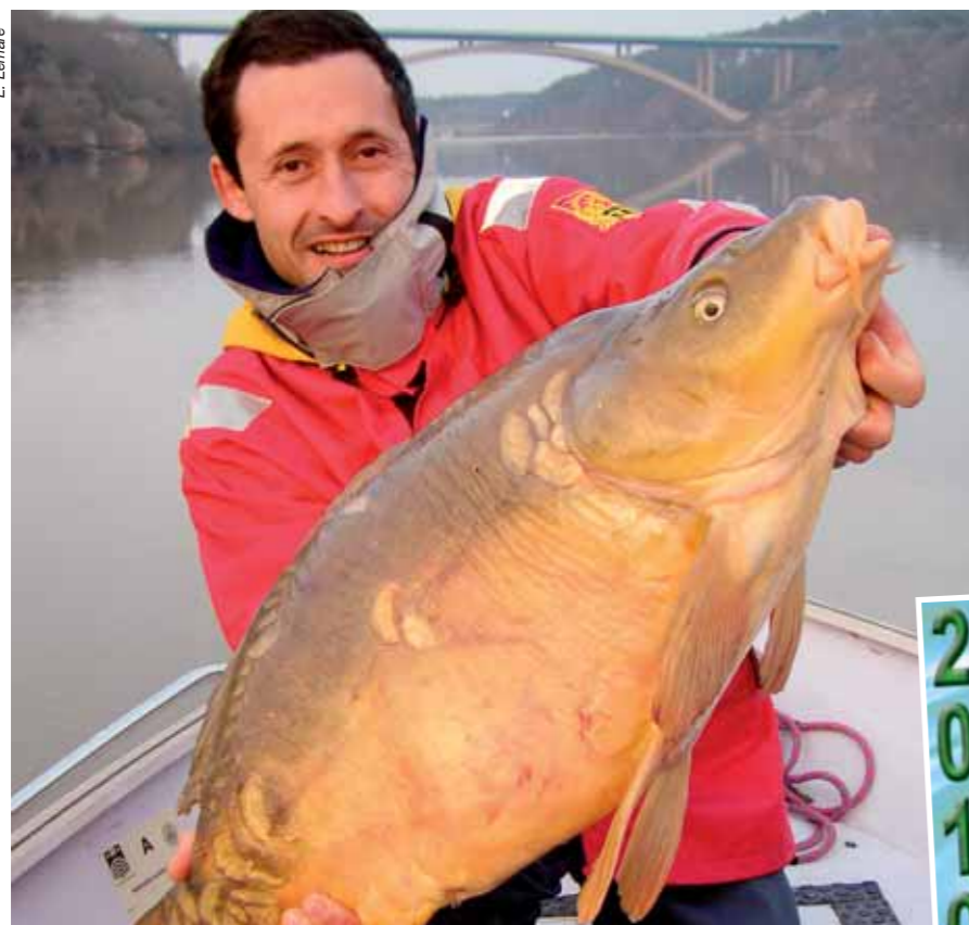
Désormais, les pêcheurs se déplacent beaucoup plus qu'auparavant. C'est particulièrement vrai pour certaines pêches spécialisées comme celle de la carpe.

En premier lieu, ils ont décidé de la création d'une carte interdépartementale « tout en une » intégrant la carte de pêche majeure, la Cotisation Pêche et Milieu Aquatique (CPMA) et la vignette réciprocaire EHGO. Pas révolutionnaire?