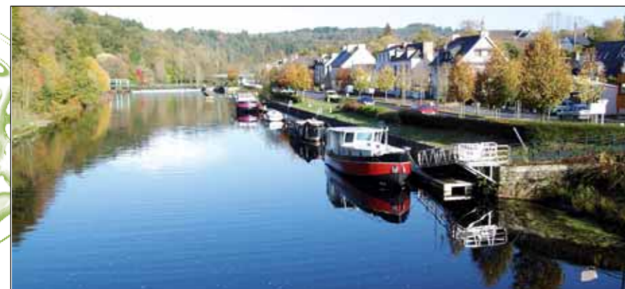
L'aménagement de cales de mise à l'eau sur le Blavet profiterait aussi bien aux pêcheurs touristes qu'aux pêcheurs locaux.

L'enjeu économique concerne surtout les hébergeurs et autres acteurs du tourisme. Néanmoins, les aménagements réalisés profiteront aussi aux pêcheurs locaux et morbihannais. C'est pourquoi la Fédération et les AAPPMA concernées (Lorient, Melrand, Baud) appuient fortement ce projet et en seront partie prenante.