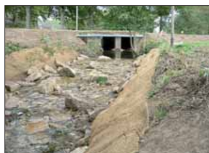
Ruisseau de la Bouloterie : la chute de 60 cm autrefois difficilement franchissable est à présent totalement effacée et facilement franchissable quelles que soient l'espèce de poisson et la taille.