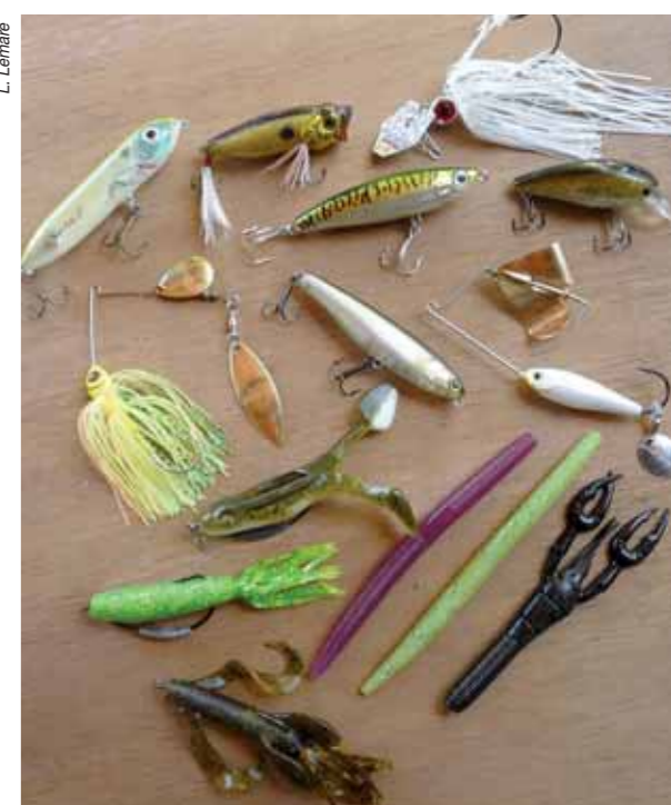
Des leurres pour toutes les conditions, toutes les situations !