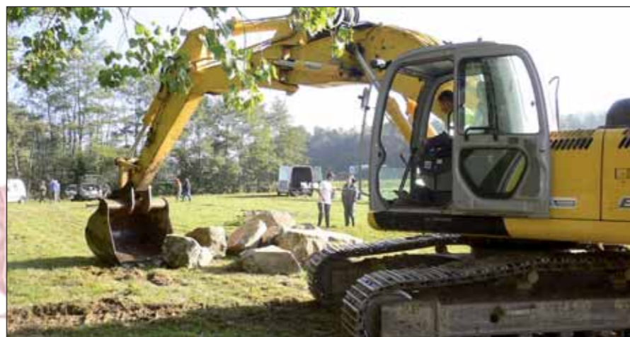
Des gros moyens ont été mobilisés pour déposer des blocs de plusieurs tonnes.

des bénévoles individuels et des propriétaires riverains ont participé au chantier qui a concerné 2 300 m de cours d'eau.