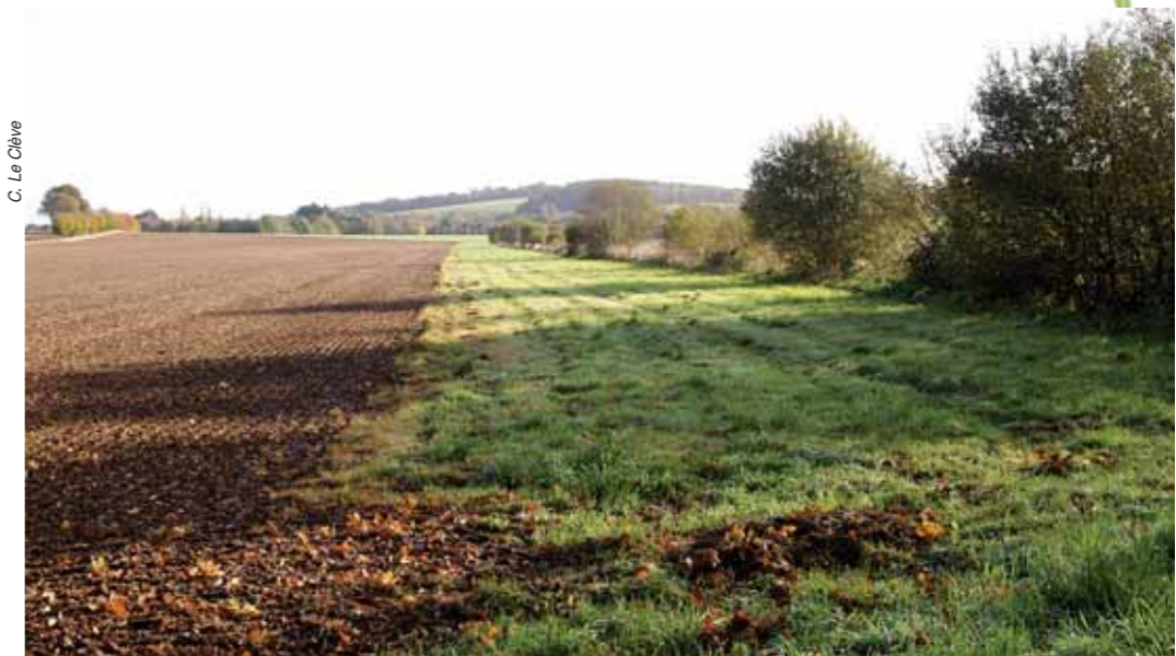
Si les bandes enherbées sont efficaces pour limiter les transferts de polluants et de terre vers les cours d'eau, pourquoi ne pas les imposer sur la totalité du réseau hydrographique ?