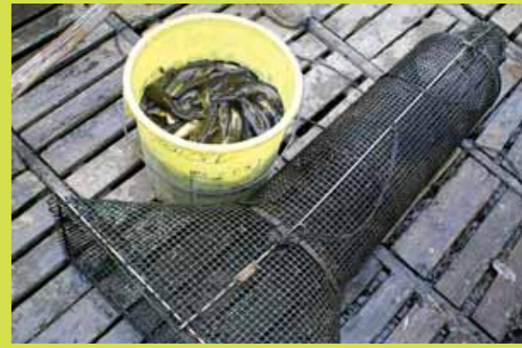
Avec une nasse.