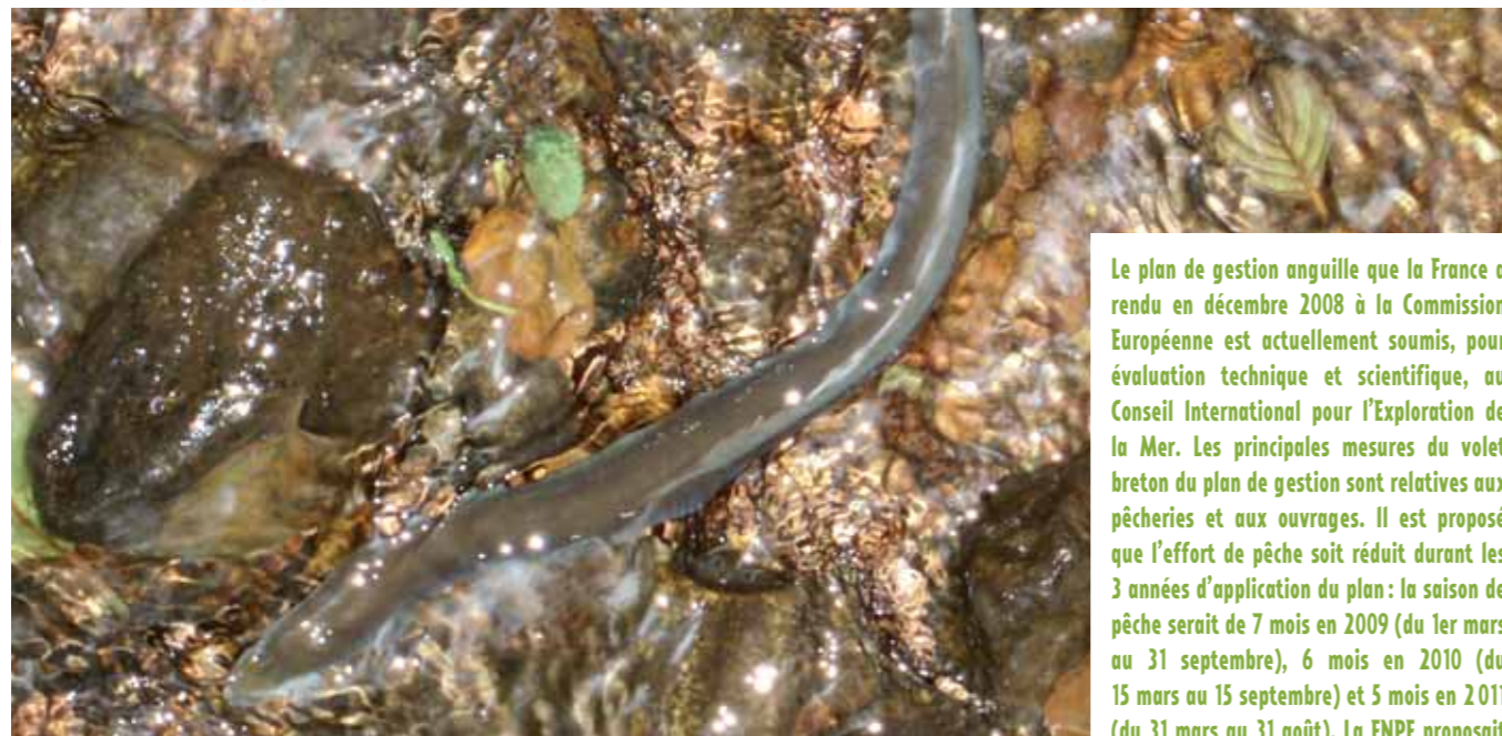
Y. Le Clairéche

Le plan de gestion anguille que la France a rendu en décembre 2008 à la Commission Européenne est actuellement soumis, pour évaluation technique et scientifique, au Conseil International pour l'Exploration de la Mer. Les principales mesures du volet breton du plan de gestion sont relatives aux pêcheries et aux ouvrages. Il est proposé que l'effort de pêche soit réduit durant les 3 années d'application du plan : la saison de pêche serait de 7 mois en 2009 (du 1er mars au 31 septembre), 6 mois en 2010 (du 15 mars au 15 septembre) et 5 mois en 2011 (du 31 mars au 31 août). La FNPF proposait quant à elle un moratoire d'interdiction de toute pêche sur une période de cinq ans, moratoire qui n'a pas été retenu.