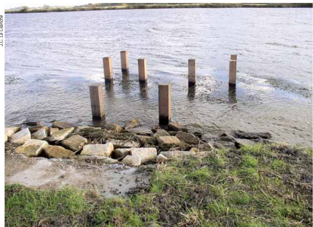
J.C.L.C. Au Rohello, sur la Vilaine, les pieux sont déjà posés et en attente de la plate forme de pêche.