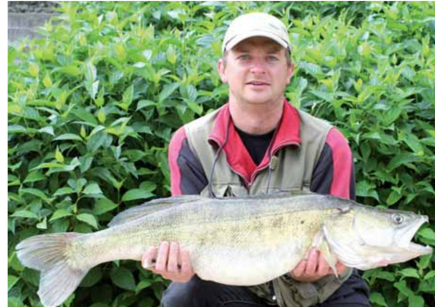
De nombreuses captures de gros carnassiers en 2009, ici un sandre de 92 cm capturé sur l'aval de l'Oust.

Pour l'ouverture du 9 mai, les conditions étaient idéales pour les pêcheurs rencontrés en nombre sur le bord des canaux, lacs et étangs de seconde catégorie. Un peu partout, de bons résultats ont été observés en brochet, perche et sandre. Ces derniers ont, cette année encore, fait l'objet de prélèvements importants sur frayère. Pour exemple, ce pêcheur contrôlé à Guerlédan, le dimanche de l'ouverture, avec 6 poissons « charbonniers » conservés entre 40,5 et 45 cm. Nous le rappelons chaque année: en début de saison, le sandre est