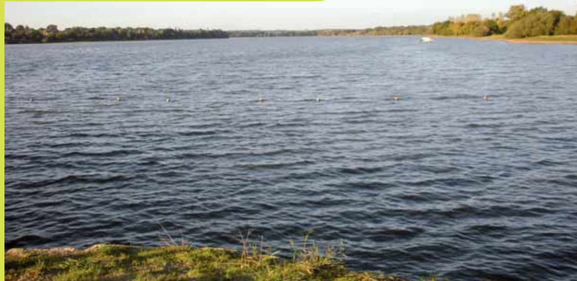
Sur le lac au Duc, la pêche se décline pour tous les goûts sur 250 ha.