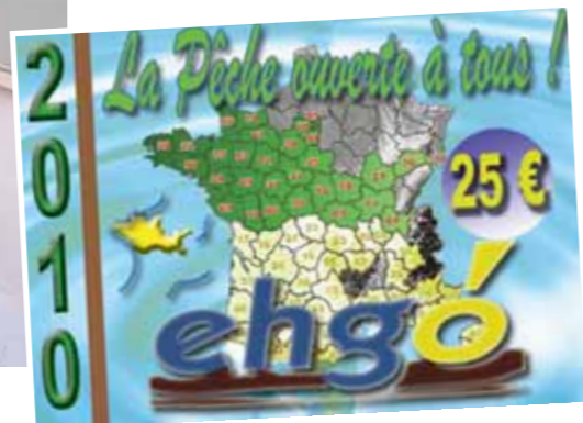
Le timbre seul pourra être acheté au tarif unique de 25 euros.