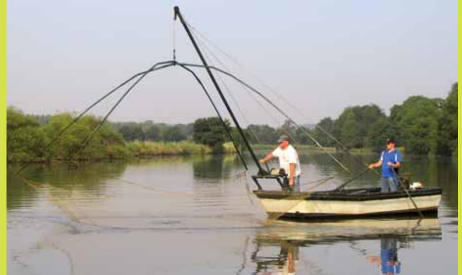
La pêche au carrelet.

La pêche amateur aux engins compte 150 licenciés dans le Morbihan. Cette pêche qui fut nourricière en d'autres temps reste aujourd'hui une tradition pour bon nombre de ses amateurs.