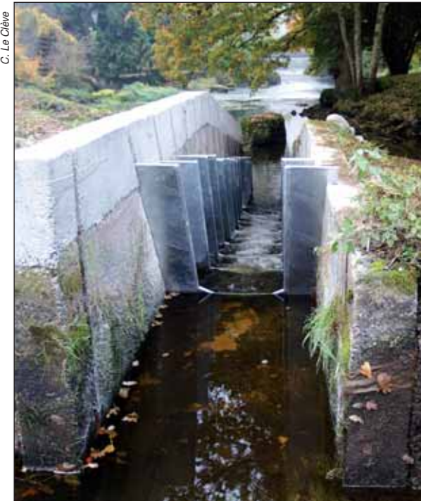
C. Le Clève

Sur le moulin de Coat crenn, les travaux ont consisté à réhabiliter l'ancienne passe et à créer une passe à anguillettes.