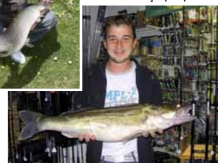
A 2 cm du record !