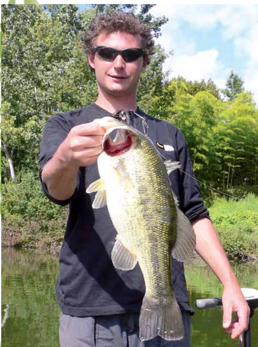
Lorsque le black-bass n'est pas repérable en surface, l'utilisation d'un spinner bait permet de prospector des zones encombrées (amas de branches...) sans risquer de perdre trop de leurres.

L.L. Réserve temporaire pour la protection des frayères.