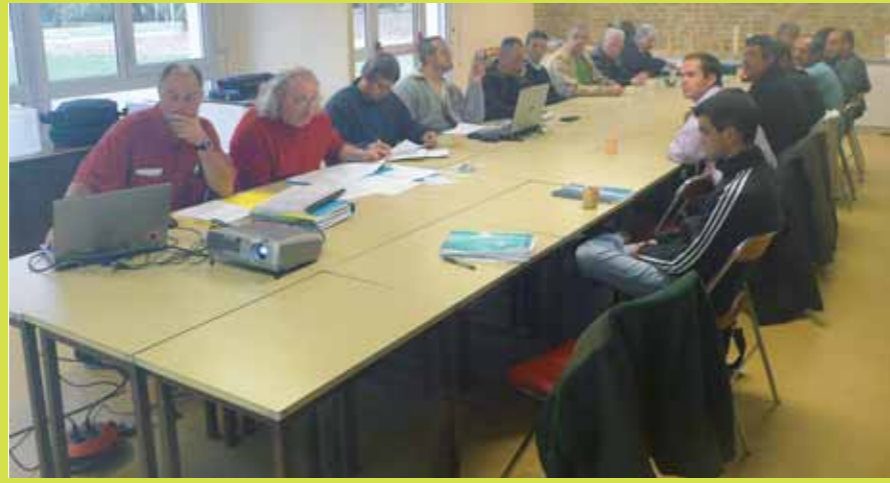
1 ère rencontre de l'amicale des gardes pêche particuliers le 3 octobre à Baud.

En 2010, 33 gardes pêche particuliers sont assermentés sur le département. L'esprit qui les guide dans leurs missions, c'est avant tout de conseiller, renseigner et d'informer les pêcheurs. Ces béné-