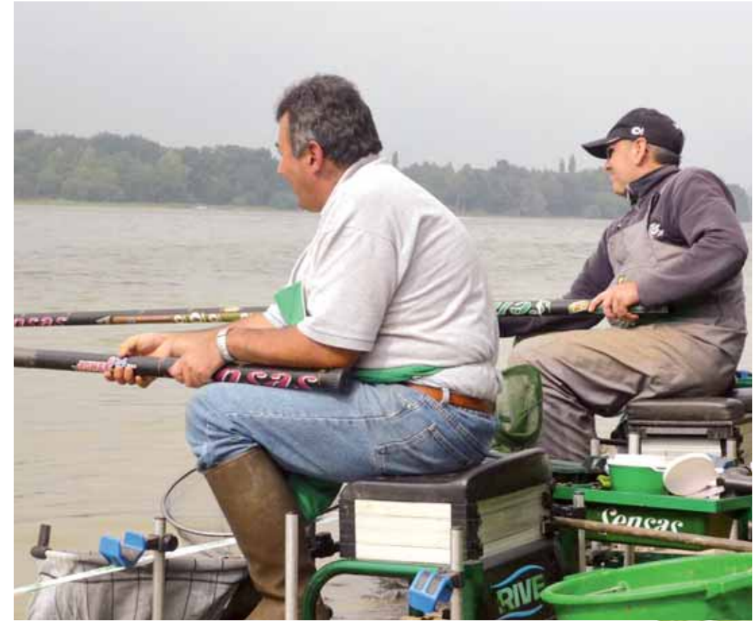
Des conditions difficiles pour le marathon sur le lac au duc à cause du fort vent qui a balayé le plan d'eau.

c'est ce que proposait l'AAPPMA de Lorient avec le partenariat du service jeunesse de la ville de Lochrist, le dernier dimanche juin, sur les bords du Blavet. Tout le matériel était fourni, il fallait juste s'inscrire pour 1€, apporter son pique-nique... et essayer de prendre des poissons dans la bonne humeur.