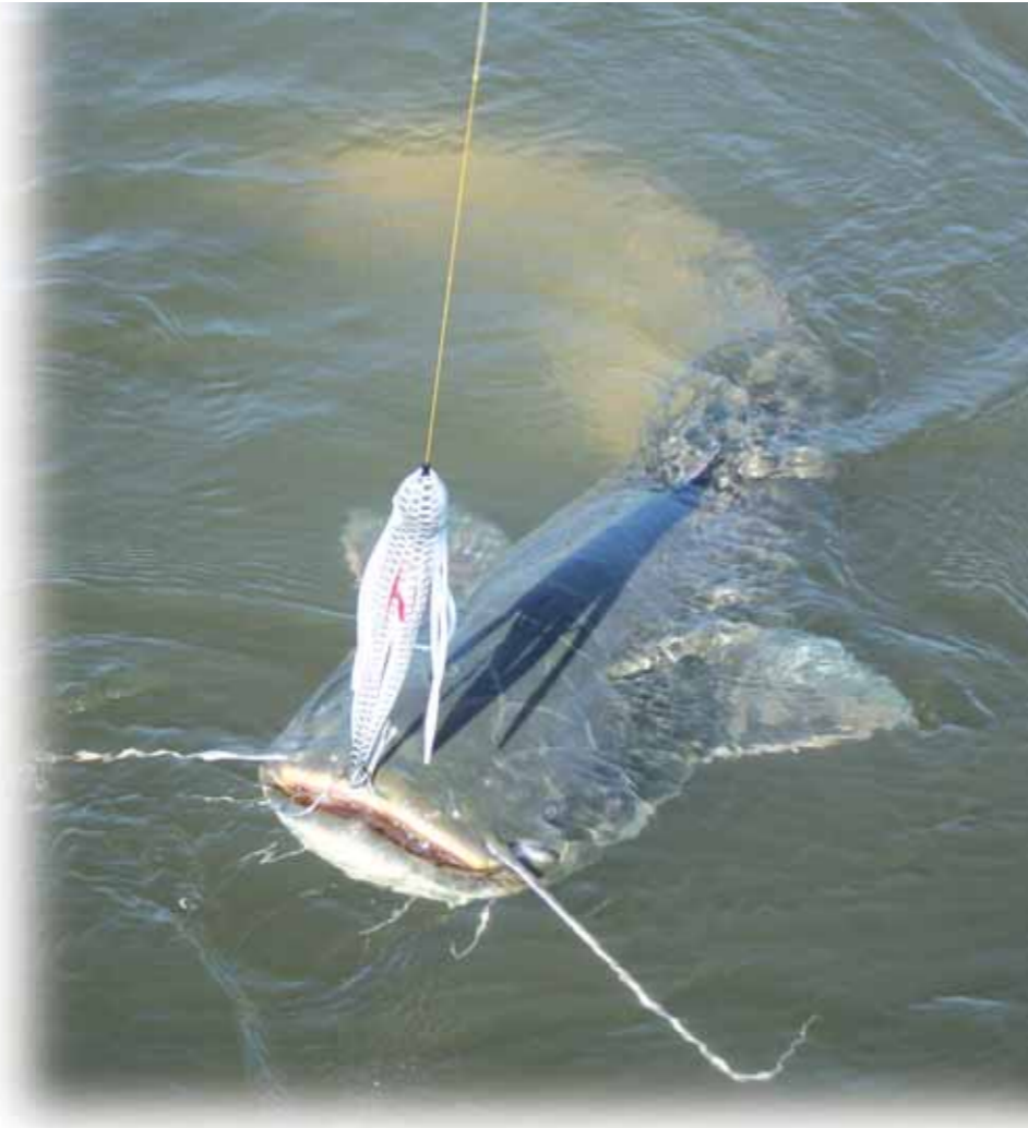
Oust-Vilaine : le silure poursuit son implantation.

- Les variations de débits au barrage EDF de Guerlédan sont également disponibles sur la page de l'AAPPMA de Pontivy.