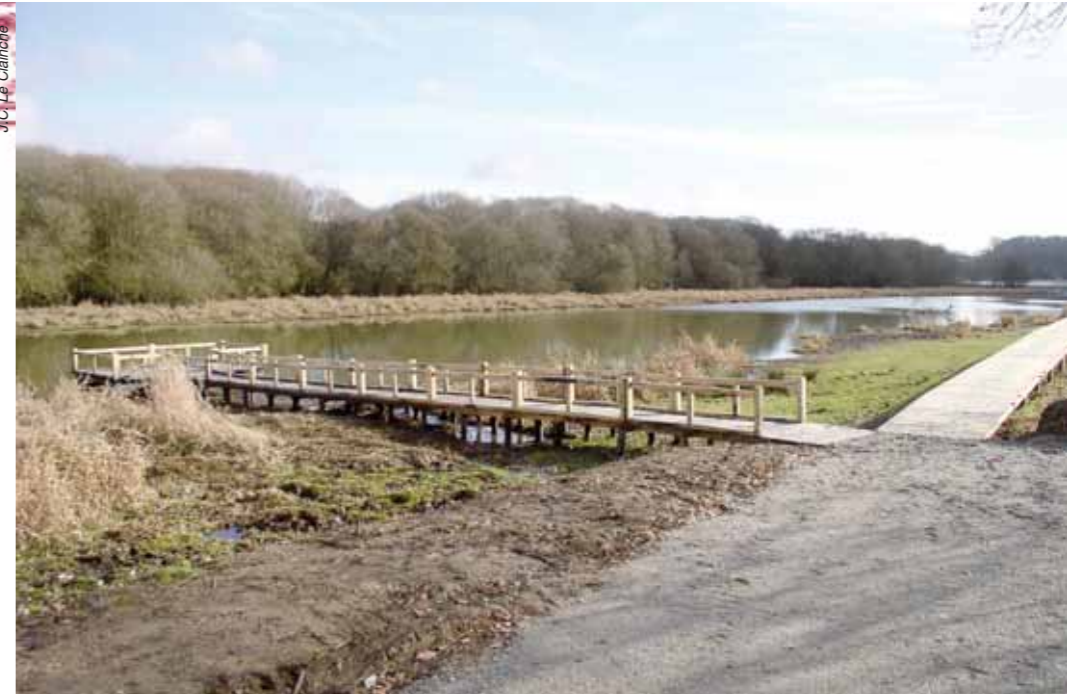
Un poste de pêche sur les berges de l'étang au Duc.

Afin de permettre aux porteurs de projets de réaliser des postes de pêche pour personnes à mobilité réduite dans de bonnes conditions, un guide d'installation va être élaboré à l'échelle du département du Morbihan.