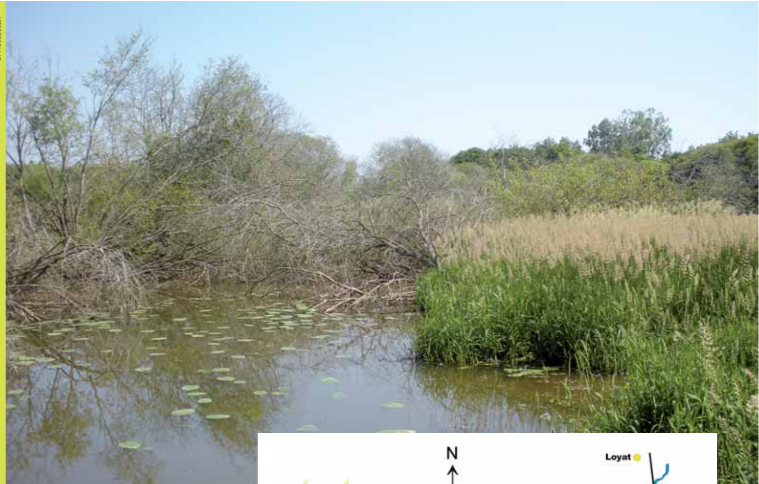
Très connue des pêcheurs locaux, la zone de marais située en amont du Lac au Duc (Lieu dit Caulne) offre de nombreuses zones de frayères pour le Brochet et les poissons blancs.