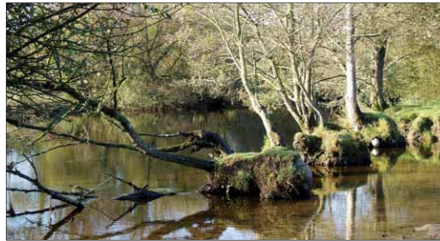
Le Blavet à l'amont de Poulhibet : l'un des secteurs sur lesquels le test aurait du être mené.