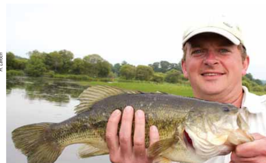
Le black-bass s'est acclimaté sur certains secteurs du département, ici un beau sujet capturé sur le secteur de la basse oust.