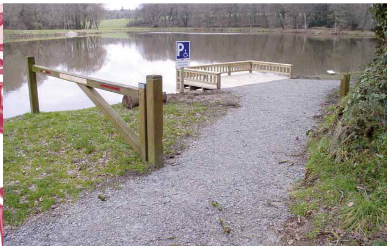
A Kerguéhennec, le poste de pêche permet aussi de découvrir les œuvres d'art.