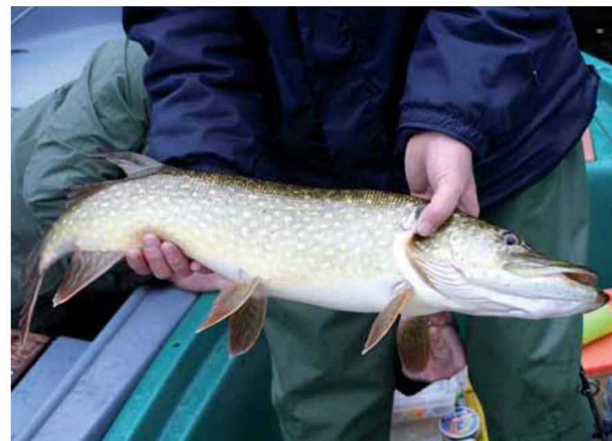
Un magnifique brochet capturé aux leurres au lac de Guerlédan. ▼