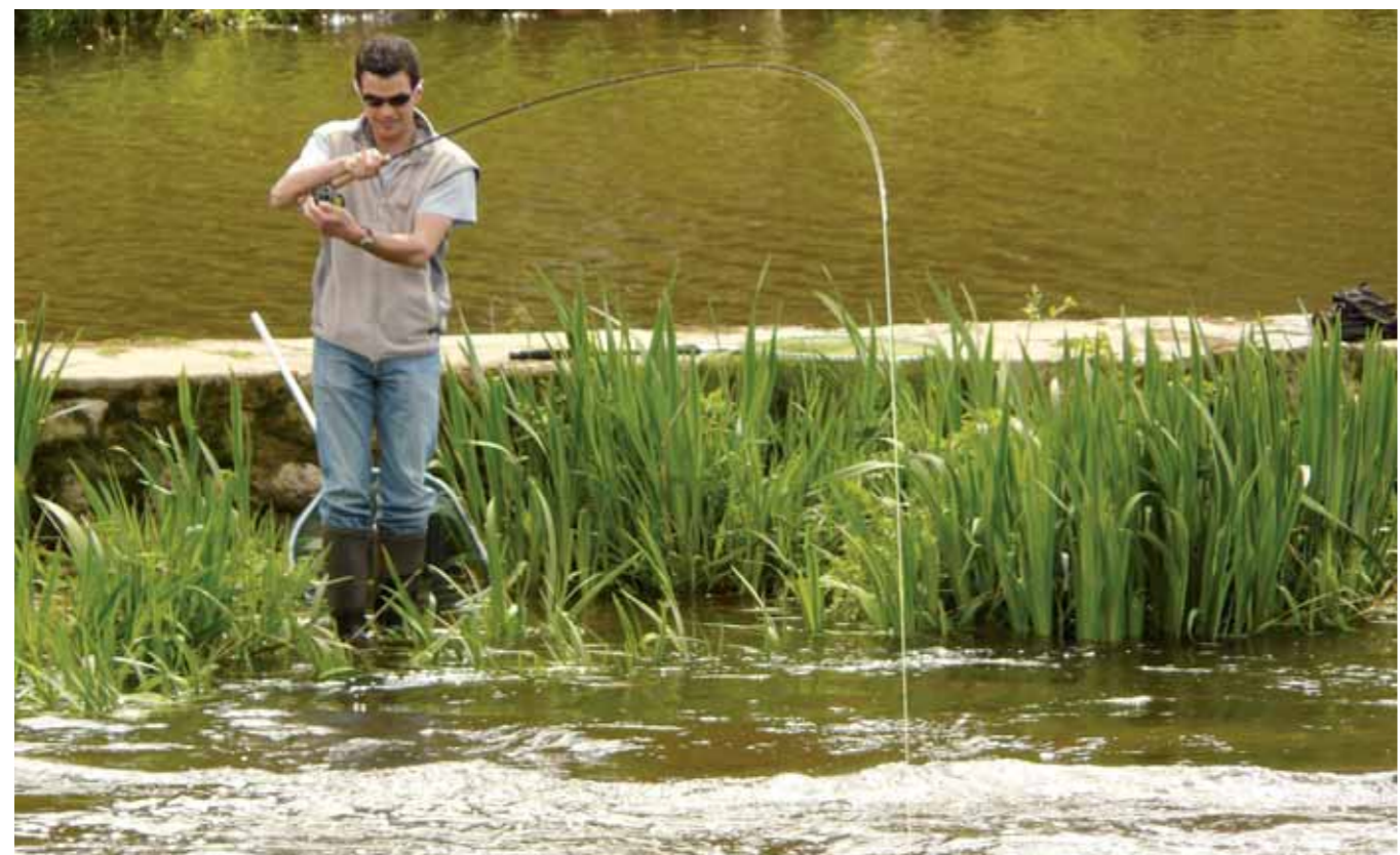
Une alose à la mouche, c'est vraiment sportif.

A souligner aussi le dossier déposé par le syndicat du Blavet auprès du Conseil Régional pour la création « d'un pôle pêche en Bretagne intérieure ». La suite somme toute logique pour une collectivité qui investit depuis 20 ans pour son patrimoine aquatique.