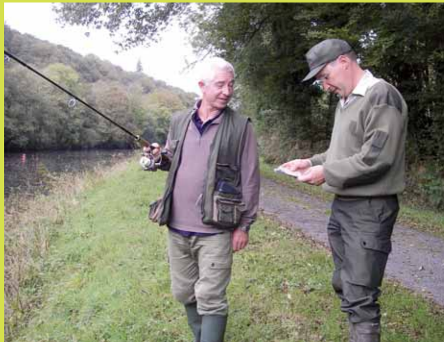
Tous les gardes pêche particuliers ont été dotés par la Fédération de la tenue choisie et mise en place au niveau national.

voles sont les relais de terrain des conseils d'administration des AAPPMA. Tout en rappelant cependant, à celles et ceux qui seraient tentés d'ignorer la réglementation qui s'applique, qu'ils sont