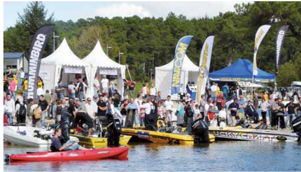
Le 2 e Open carnassier, un beau succès populaire.

de l'écluse des Gorêts, que la concentration la plus forte est observée. La fréquentation de plus en plus régulière de ce site par certains pêcheurs locaux et de l'hexagone, a fait naître l'idée d'organiser une manifestation pour faire connaître au plus grand nombre ce combattant hors norme. La Fédération et l'AAPPMA du pays de Lorient, gestionnaire de cette partie du Blavet ont travaillé ensemble pour faire naître la première compétition de pêche consacrée à cette espèce en Bretagne. 21 pêcheurs à la mouche, seule technique autorisée, se sont ainsi retrouvés les 18 et 19 avril sur les rives du Blavet pour en découdre. Le samedi, les premières captures se sont faites attendre jusqu'à la fin de la matinée. 4 au total ont été validées par les commissaires le samedi : seuls les poissons capturés par la bouche étaient comptabilisés. La baisse du niveau d'eau, le vent de nord ouest ont rendu la pêche difficile le dimanche : aucun poisson n'a été enregistré sur cette deuxième manche, seule petite déception du week-end. Car ce premier safari Alose, qui s'est déroulé dans une excellente ambiance, avec du public et des partenaires (Syndicat du Blavet, SAGE Blavet), a permis de démontrer que la pêche peut, même si les poissons